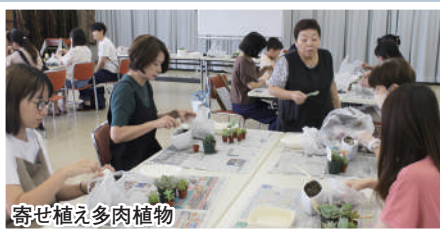
寄せ植え多肉植物

次年度においても、こうしたイベントや事業を通じて、地域の方々楽しんで交流を深めていただけたら幸いかと考えております。一年間、皆様方のご協力に感謝申し上げます。