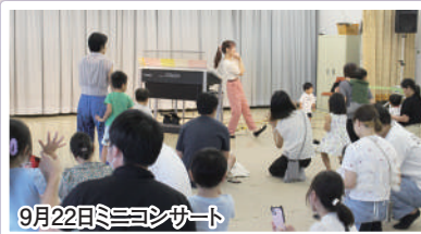
9月22日ミニコンサート

私たち、福祉子育て部会では、地域の子育て世代を中心とした皆さん方の交流のため、「くらしみんなの広場」の「カフェさんやほう」の他、親子ヨガ、親子観劇会、親子ミニコンサートなどを開催しました。多くの方と楽しい時間を過ごせたことに感謝しています。その中で私が「倉知は素敵だな」と思ったのはお父さん方も楽しそうに参加して下さる姿でした。