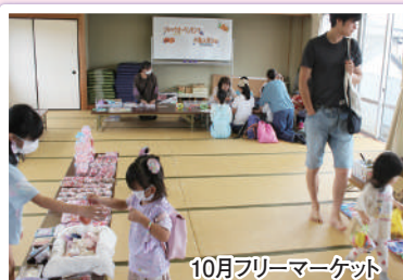
10月フリーマーケット