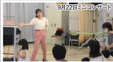
9月22日ミニコンサート